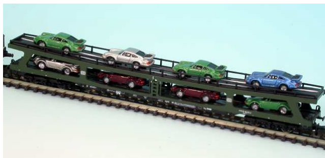
Porsche 911 turbo – wohin man schaut