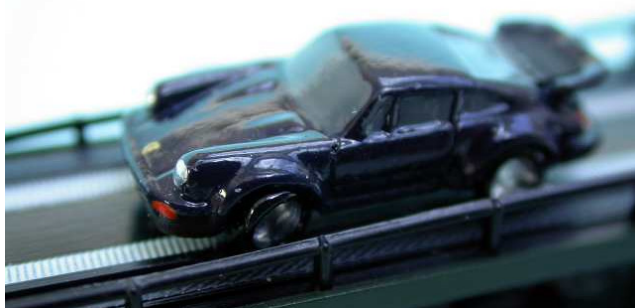
ein schwarzer 911 Turbo