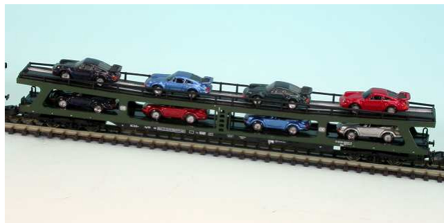
Hmm – einer würde schon reichen....