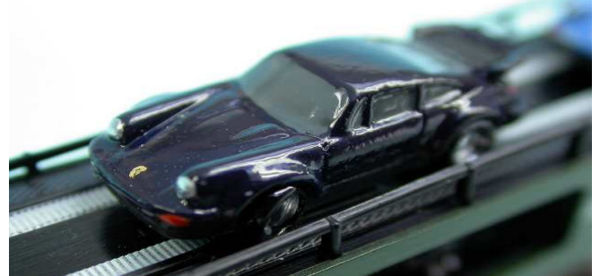
... na, das wär's doch was.....