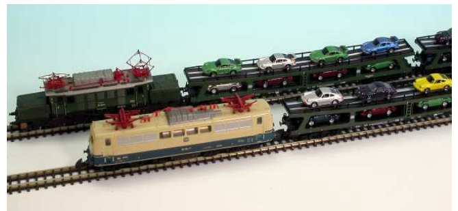
Zwei Güterzugveteranen: eine aktuell gesuperte E94 und eine vor 20 Jahren gesuperte BR 151