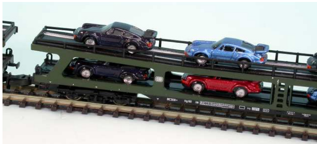
auch aus der Nähe, alles einfach perfekt