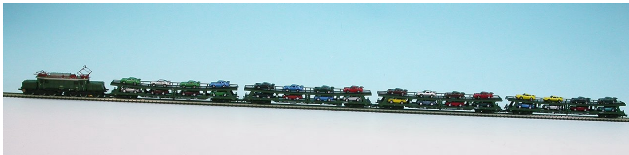
Beispiel für einen Ganzzug Autotransport in Z, der auch gezogen werden kann

Unsere E 94 zog in der Ebene problemlos 4 - 5 vollständig beladene Waggons. Es ist schwer, ohne geeignete Fotostrecke hier ansprechende Bilder zu machen, aber auch die vorliegenden Ergebnisse sprechen für sich.