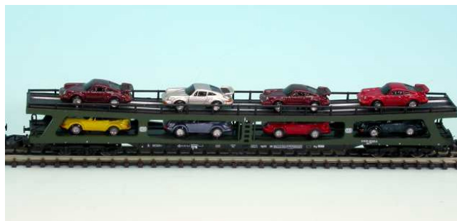
Unzählige verschiedene Farben sind lieferbar