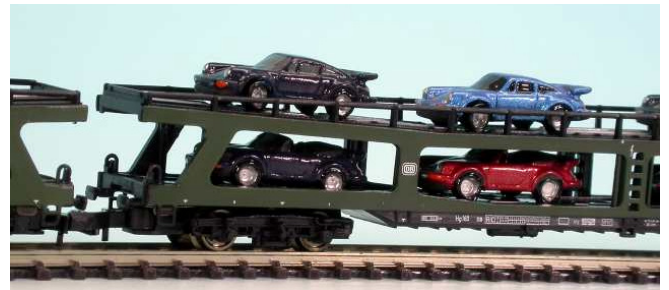
oben Turbo – unten Cabrio, die Inneneinrichtung darf nicht nass werden.....