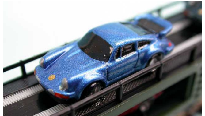
Einfach wunderschön, die Farben und alles in einer so hohen Qualität