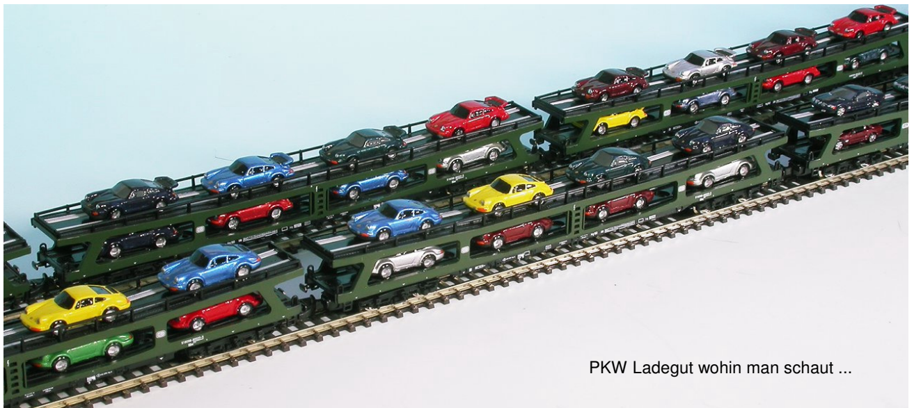
PKW Ladegut wohin man schaut ...