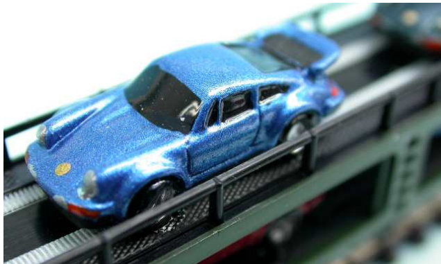
Metallic Lackierung vom Feinsten - oder ist es ein Brillanteffektlack?