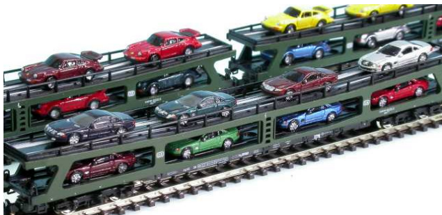
Ups, da hat sich bei den Zuffenhausenem ein Untertürkheimer eingeschlichen – na, macht nichts, die bauen auch gute Autos.....