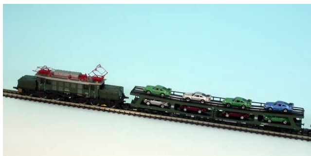
Vorn zieht eine gesuperte E 94 – dann kommen viele Traumautos....